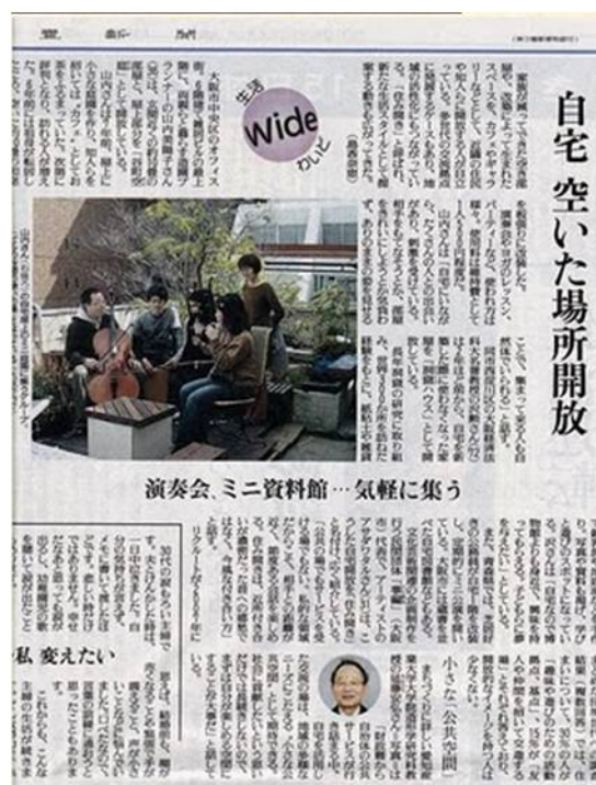
「住みびらき」読売新聞 2010. 4. 6

住みびらきとは、自宅や個人事務所などの私空間をセミパブリックなスペースとして開放（公空間）している活動のことである。その行為や活動を行っている意図は、各人様々であるが、青森県八戸市では中心市街地活性化のためにこの住み開き実験を行おうとしている例もある。同様の趣旨のものとして近年、地域の生活や文化を体験する、まち歩きをするーといった新しい観光スタイルが登場し、一般の住宅や店舗において、こうした観光客に自分の庭園などを公開する「オープンガーデン」や、ひな人形・屏風・蔵などを公開する私的空間開放の取り組みの例なども見られる。このように、最近では公空間に私空間を展開する取り組みだけでなく、私空間に公空間を展開する取り組みもよく見られるようになってきた。