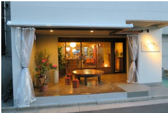
バックパッカーズ宮島

国内のゲストハウスは約800~1000ともいわれ、空前のゲストハウスブームとなっている。ブームの先駆けは東京の「toco.」「Nui.」などであるが、広島県では尾道市に「あなごのねどこ」、廿日市宮島に「バックパッカーズ 宮島」があり、広島市中心部には「広島ゲストハウス碌 roku」がある（次写真）。また、ゲストハウスではないが、演奏会や展覧会を行い地域の交流拠点となっている「コミュニティサロン可笑屋」や、住民自ら発案し住宅の一部を改装した地域カフェ「みちくさ」、長屋の再生を通じてその内部に建物・敷地レベルで共用空間を創出している「からほり倶楽部」など地域の交流空間を自分たちで創る動きも出てきている。