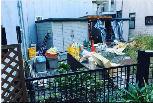
元は物置にしかならなかった裏庭