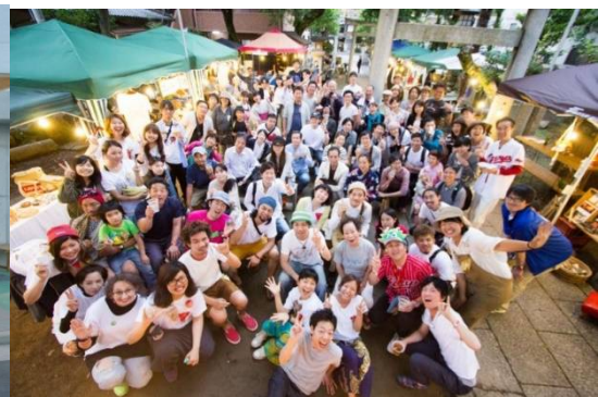
ゲストハウス碌

広島ゲストハウス碌 roku は、広島市中心街から近い白島エリアに2014年6月9日に一軒家を改装してOPENした宿である。こうした、ゲストハウスが地域の交流空間となっているかどうかについて、「広島ゲストハウス碌 roku」の周囲半径150mの地域住民へのアンケート調査結果（藤本研究室）でわかったことは、宿泊者以外も交流空間が利用できることを知っている地域住民が70%もおり、年代別に見ても、特に40~50代の