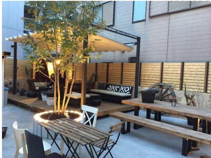
ポケットパークに生まれ 変わった裏庭