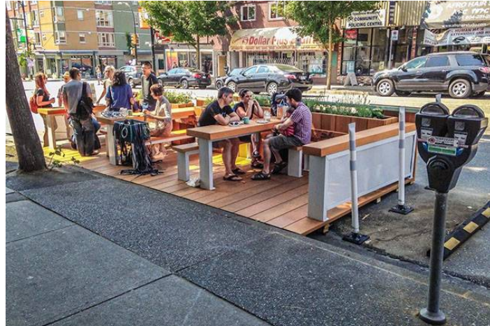
Daily MIV “The rise of the parklet in Vancouver” Modacity

日本では道路空間を使用するには厳しい制約があったが、都市再生特別措置法の「道路占用許可の特例」などの近年の規制緩和で道路空間を弾力的に利用促進する方向には向かっている。しかし、その一方でもう一つの制約である交通管理者である警察の「道路使用許可」がネックとなっている。そこでパークレット（Parklet）のように、一時的利用のコインパーキングを車から取り戻しパブリックスペースに転用したり、駐車場から車を締め出してカフェに転用したりというような、近年話題となっている「タクティカル・アーバニズム」（TACTICAL URBANISM）のエリア・マネージメントにより、車から道を取り戻す可能性が生まれる。